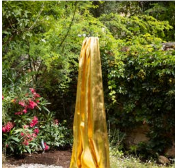
Εντυπωσιακά έργα σύγχρονης τέχνης κοσμούν ακόμα και τον κήπο του ARTFLYER

A.A.: Με συναρπάζουν οι γυναίκες που έχω φιλοξενήσει στο artflyer.net. Ίσως γιατί παλαιότερα συνηθίζαμε να μιλάμε κυρίως για μεγάλους άντρες καλλιτέχνες. Μου άρεσε πολύ η εμπνευσμένη επιλογή της Κίκι Σμιθ να στείλει ένα πόστερ με τις μέλισσες της βορείου Αμερικής αφυπνίζοντάς μας για ένα θέμα τόσο σημαντικό, όπως η εξαφάνιση των μελισσών. Χάρη στην ακούραστη δουλειά των επικονιαστών, διατηρείται η διατροφική μας αλυσίδα. Ξεχωρίζω επίσης την επιλογή της Τζοάνα